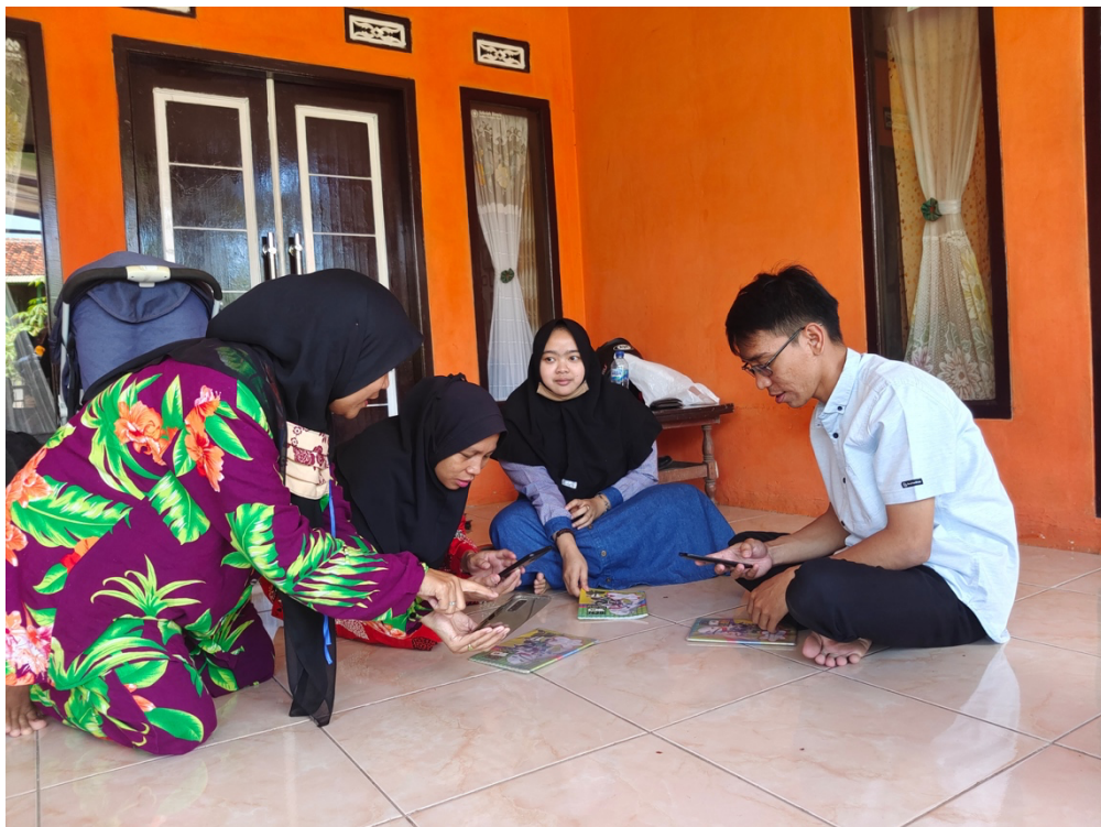
Gambar 2. Proses pelaksanaan PkM

Program pengabdian kepada masyarakat ini dilaksanakan di Kelurahan Kahuripan, Kecamatan Tawang, Kota Tasikmalaya. Sasaran kegiatan ini yaitu untuk meningkatkan kualitas sumber daya manusia melalui pelaksanaan pelatihan kepada UMKM agar mampu membuat pencatatan transaksi berbasis digital. Lebih lanjut sasaran dari program ini yaitu memudahkan UMKM untuk mengakses program kredit yang dicanangkan oleh pemerintah. Manfaat lain dari kegiatan yaitu meningkatnya kerjasama antara masyarakat dan perguruan tinggi sebagai mitra dalam pengembangan perekonomian daerah.