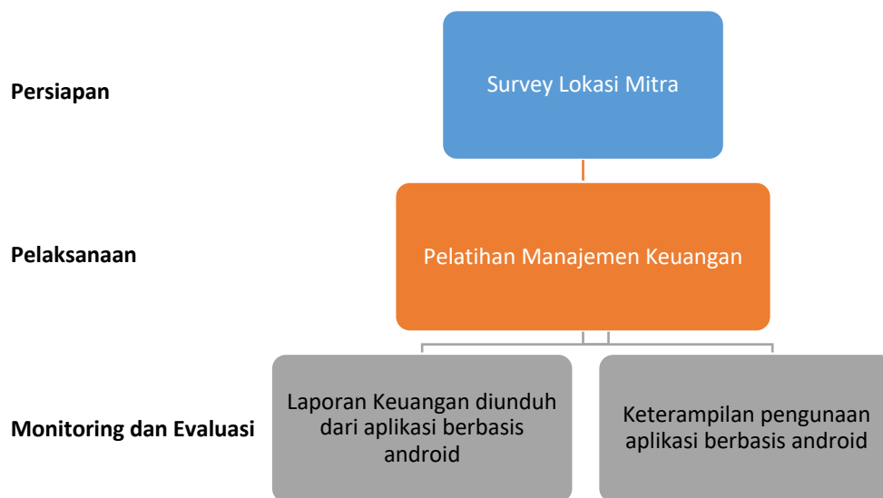
Gambar 1. Metodologi pengabdian kepada masyarakat

Tahapan kedua yaitu pelaksanaan program pelatihan. Pada tahap ini dilakukan beberapa kegiatan antara lain penyampaian materi terkait pentingnya manajemen keuangan dalam UMKM, memberikan pemahaman literasi pencatatan transaksi keuangan UMKM, memberikan pelatihan penggunaan aplikasi berbasis digital dalam pencatatan transaksi, dan memberikan pelatihan membaca laporan keuangan yang dihasilkan oleh aplikasi.