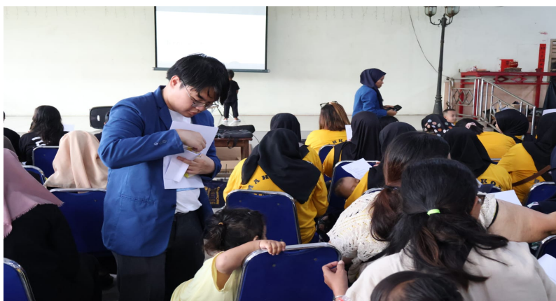
Gambar 2. Pembagian kuesioner pre-test dan post-test

Tabel 3 menunjukkan peningkatan distribusi skor setelah penyuluhan. Sebanyak 36 subjek (45%) berhasil menjawab seluruh pertanyaan dengan benar. Jumlah subjek yang mendapatkan skor 83 juga mencapai 45%, sedangkan yang mendapatkan skor 67 sebanyak 10%. Tidak terdapat subjek dengan skor di bawah 67, yang mengindikasikan seluruh peserta mengalami peningkatan pengetahuan setelah penyuluhan.