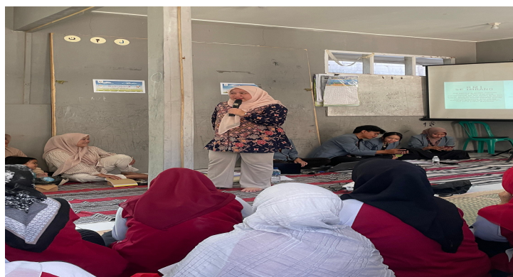
Gambar 2. Pelaksanaan edukasi gizi

Kegiatan pengabdian masyarakat dilakukan di salah satu lokus stunting di Kota Sukabumi, Kelurahan Sukakarya pada bulan Juni 2023. Pelaksanaan pengabdian Masyarakat ini merupakan rangkaian kegiatan dari P2MB Tematik Stunting yang dilaksanakan oleh Universitas Pendidikan Indonesia yang bekerjasama dengan BKKBN Provinsi Jawa Barat dalam upaya penanganan stunting. Edukasi kepada ibu balita dan kader PKK ini bertujuan untuk meningkatkan literasi keuangan dan berhubungan dengan penyediaan makanan bergizi di rumah bagi kelompok berisiko stunting di kelurahan tersebut. Proses kegiatan dimulai dengan memberikan edukasi dan informasi mengenai materi food budgeting , gizi seimbang dan informasi umum mengenai stunting. Tahapan berikutnya adalah sesi tanya jawab dan diakhiri dengan penguatan materi berupa permainan yang diadaptasikan dari ular tangga yang disebut dengan “Nutriladder”.