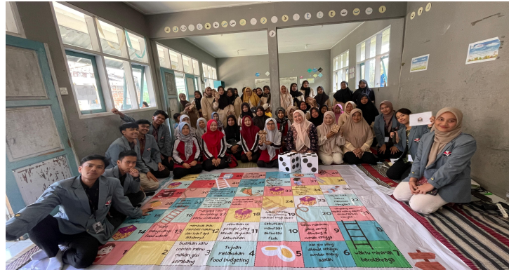
Gambar 3. Media edukasi “Nutriladder”

Berdasarkan Tabel 1 diketahui rata-rata subjek yang mengikuti kegiatan sosialisasi belajar literasi keuangan mayoritas ibu rumah tangga berusia 40-59 tahun (65,3%) dengan status perkawinan ibu menikah sebanyak 91,3%. Selain itu, diketahui juga rata-rata usia subjek saat menikah berada di usia ideal pernikahan yaitu 17-29 tahun sebanyak 37 orang (80,4%). Ditinjau dari usia subjek, dalam kegiatan sosialisasi literasi keuangan ini lebih banyak diikuti oleh ibu rumah tangga yang berusia lebih dari 40 tahun. Kelompok usia dewasa termasuk kelompok yang sudah mendapatkan cukup banyak terkait sistem pengelolaan keuangan khususnya pada pengelolaan keuangan rumah tangga. Namun, diperlukan peningkatan pengetahuan terkait literasi keuangan mengingat semakin tingginya kondisi ekonomi dan pengeluaran yang dibutuhkan.