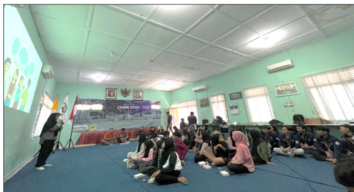
Gambar 3. Suasana pelatihan public speaking

Dalam konteks pembelajaran Bahasa Inggris sebagai bahasa kedua, idiom memegang peran penting karena mencerminkan kedalaman penguasaan budaya dan struktur bahasa yang tidak bisa dicapai hanya melalui pembelajaran gramatikal semata. Oleh karena itu, penyampaian idiom dalam pelatihan ini tidak hanya berfungsi sebagai materi tambahan, tetapi juga sebagai alat untuk meningkatkan kompetensi pragmatik peserta. Pemateri menggarisbawahi bahwa penguasaan idiom bukan sekadar menambah kosakata, melainkan membuka ruang bagi peserta untuk mengembangkan keluwesan dalam berkomunikasi serta meningkatkan rasa percaya diri dalam situasi sosial yang menuntut penggunaan Bahasa Inggris. Implikasi dari temuan ini adalah pentingnya menempatkan idiom sebagai bagian dari kurikulum pengajaran Bahasa Inggris untuk pemula. Ketika peserta berhasil memahami dan mengimplementasikan idiom yang diajarkan, mereka tidak hanya belajar bahasa dalam arti teknis, tetapi juga membangun representasi diri yang lebih positif, yang esensial dalam membentuk kepercayaan diri dan kapasitas untuk berpartisipasi dalam ruang sosial yang lebih luas.