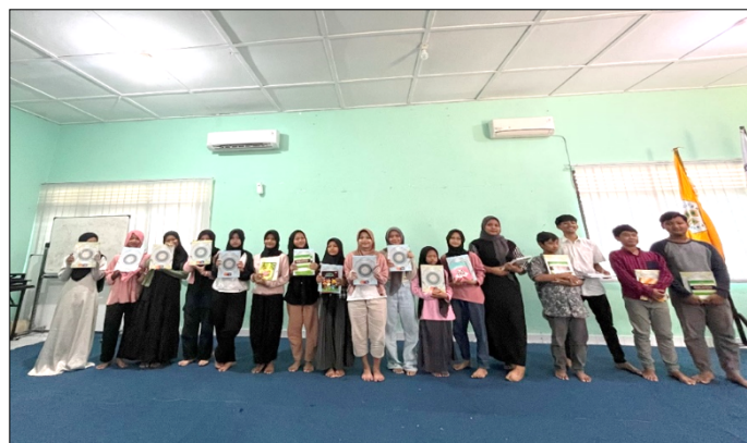
Gambar 5. Penyerahan Al-Quran dan bingkisan

Setelahnya, terdapat sesi acara pemberian bingkisan yang merupakan bantuan dari Politeknik LPP Yogyakarta serta Universitas Ahmad Dahlan. Universitas Ahmad Dahlan yang kali ini diinisiasi oleh Fakultas Sastra, Budaya, dan Komunikasi (FSBK) turut berkolaborasi dengan kampus perkebunan ini dengan mengambil peran dalam penyaluran dua puluh (20) mushaf Al Qur'an yang merupakan sumbangan dari para mahasiswa yang dikelola oleh kampus untuk berbagai kegiatan sosial (Gambar 5). Sesi pemberian bingkisan dalam rangkaian pelatihan tidak hanya berfungsi sebagai bentuk apresiasi terhadap peserta, tetapi juga merepresentasikan sinergi konkret antara institusi pendidikan tinggi dalam menjalankan fungsi sosialnya. Kegiatan ini pun berjalan dengan lancar dan ditutup dengan game oleh panitia mahasiswa yang lebih menghidupkan suasana.