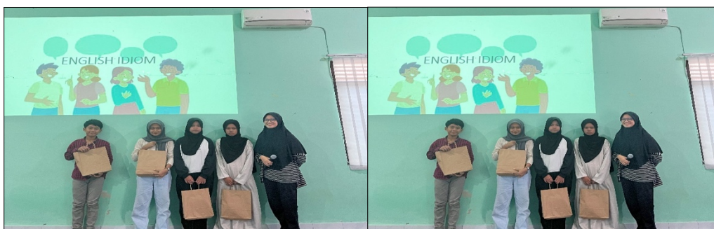
Gambar 4. Pemberian hadiah kuis

Selain itu, pemilihan idiom didasarkan pada dua pertimbangan utama: frekuensi penggunaan dalam konteks sehari-hari dan kedekatan kosakata idiom dengan jenjang pendidikan peserta. Dalam perspektif pemerolehan bahasa, kosakata yang memiliki kemiripan dengan pengetahuan sebelumnya ( prior knowledge ) lebih mudah dipahami dan diingat. Oleh karena itu, idiom-idiom yang mengandung kata-kata yang telah dikenal peserta sejak jenjang SD hingga SMA dipilih untuk memaksimalkan transfer makna dan mempercepat proses internalisasi bahasa. Strategi ini sejalan dengan prinsip scaffolding , yaitu pemberian dukungan belajar yang disesuaikan dengan kemampuan peserta agar mereka dapat naik ke tingkat pemahaman berikutnya. Dengan demikian, pemilihan sepuluh idiom bukan sekadar bentuk penyederhanaan konten, tetapi merupakan bentuk intervensi pedagogis yang didasarkan pada strategi diferensiasi dan relevansi konteks belajar. Adapun materi idiom yang dibawa disajikan pada Tabel 1.